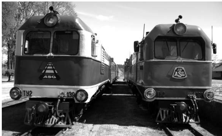
Raudonšoniai lokomotyvai suriaumos, išpūs dūmą, pajudės ir dar kartą uždainuosime: „Jau stoty sudunda traukiniai...“