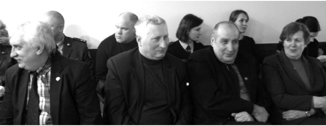
Anykščių policijos ataskaitos klausėsi rajono seniūnai.