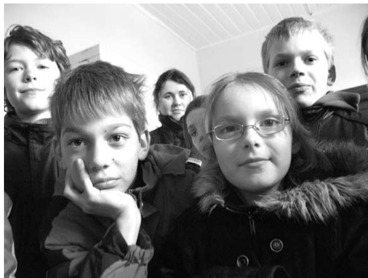
Linksmiausių ir smalsiausių siauruko lankytojų nominacijos pretendentai.