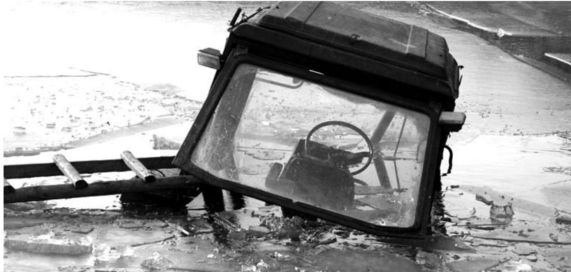
Kad pasiektų kabinoje įkalintą ūkininką, gaisrininkams prireikė kopėčių.